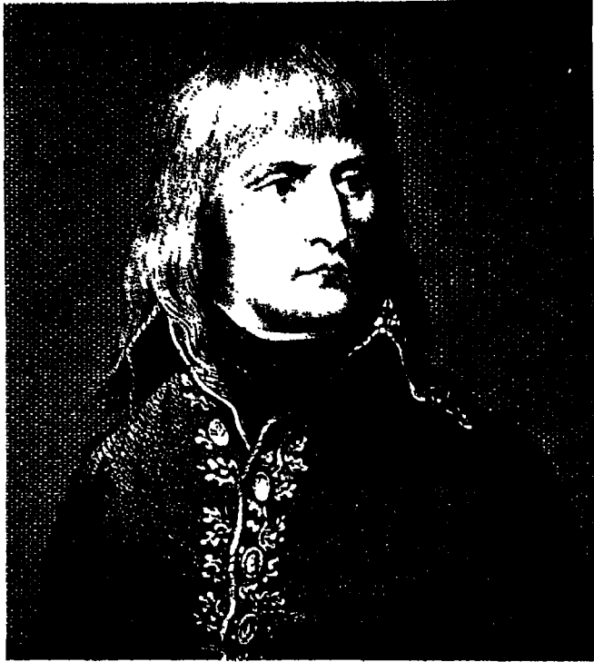
نابليون بوناپرت في شبابه .

هل بدأ التسمم في تلك الفترة أم منذ الأيام الأولى في المنفى ؟ ومن هو القاتل ؟ هناك دلائل أخرى بالتأكيد ، وسوف يلتقي في الربيع في لندن بالسيدة ميبل بالكومب بروكس حفيدة أخ بيتسي بالكومب الصغير . فلربما يكشف هذا اللقاء عن أشياء مهمة .